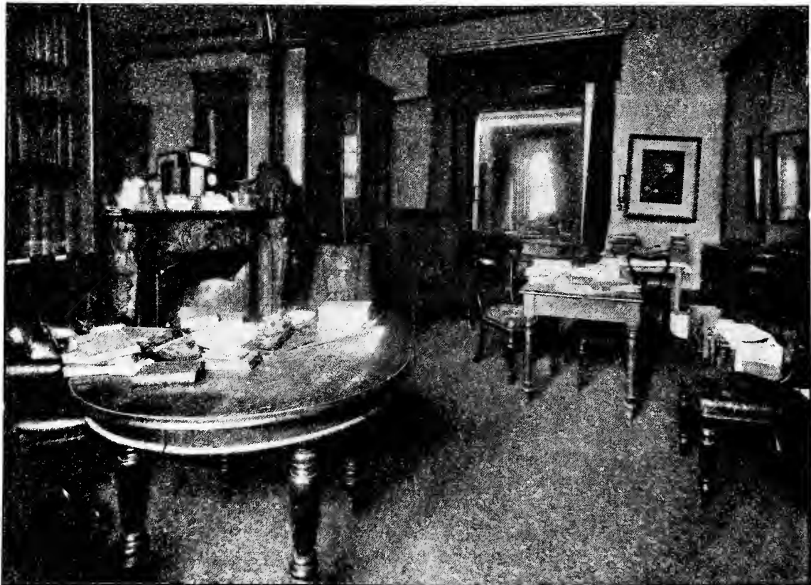
Prince Lucien Bonaparte's Library.